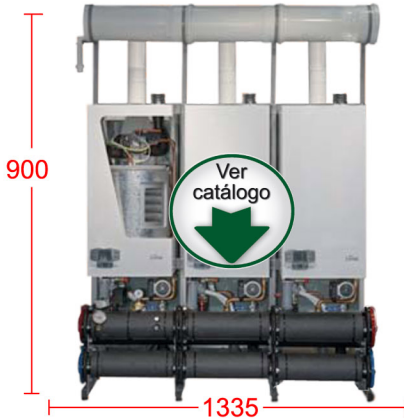
Modulo Térmico 160-1.000 Kw